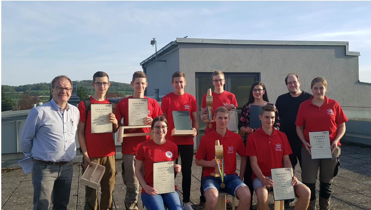
Foto: HARTL HAUS_Sieg Wettbewerb.jpg